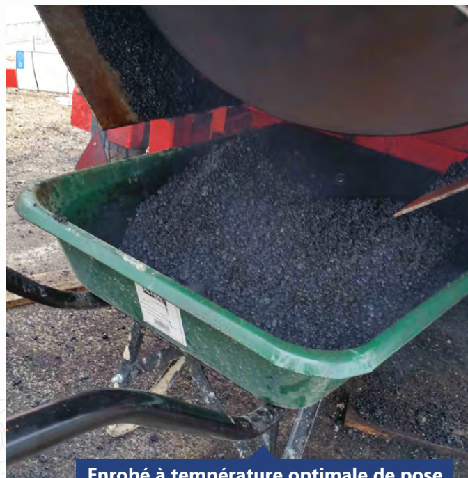
Enrobé à température optimale de pose