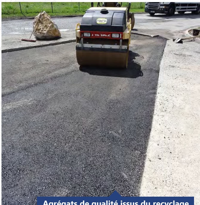
Agrégats de qualité issus du recyclage

Dimensions et informations techniques données à titre indicatif. Le constructeur se réserve le droit de les modifier sans préavis. Photos non contractuelles.