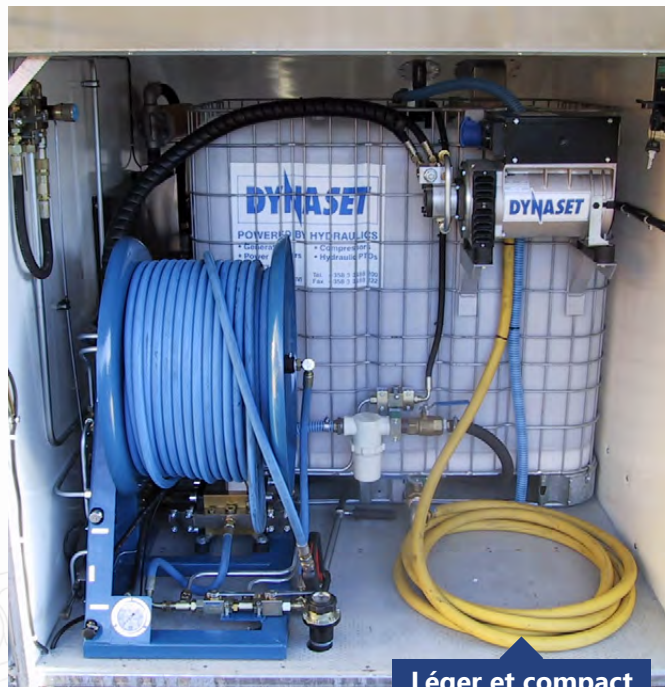
Léger et compact