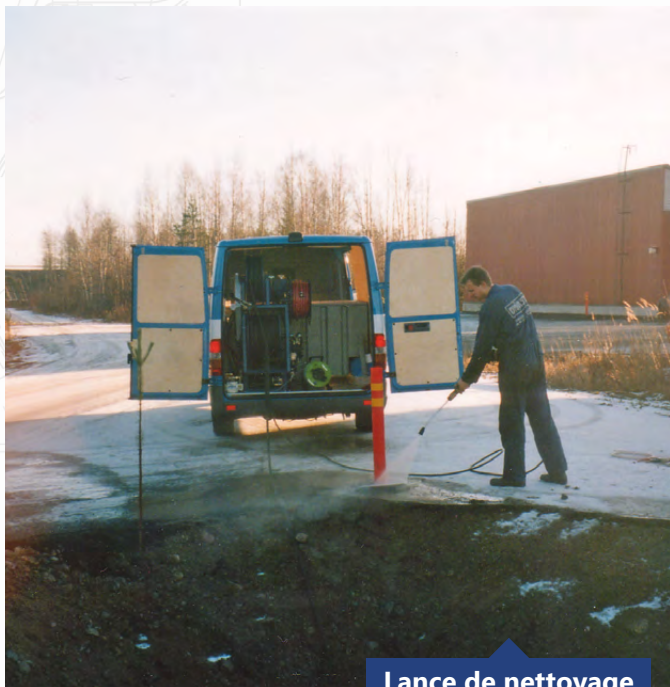
Lance de nettoyage

Dimensions et informations techniques données à titre indicatif. Le constructeur se réserve le droit de les modifier sans préavis. Photos non contractuelles.