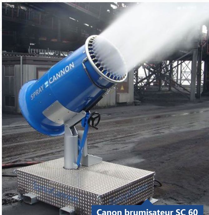
Canon brumisateur SC 60