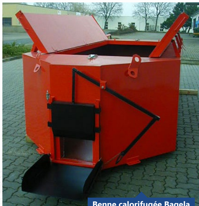
Benne calorifugée Bagela

La température extérieure peut influencer cette courbe. La quantité d'enrobé représente 90% du volume de la benne.