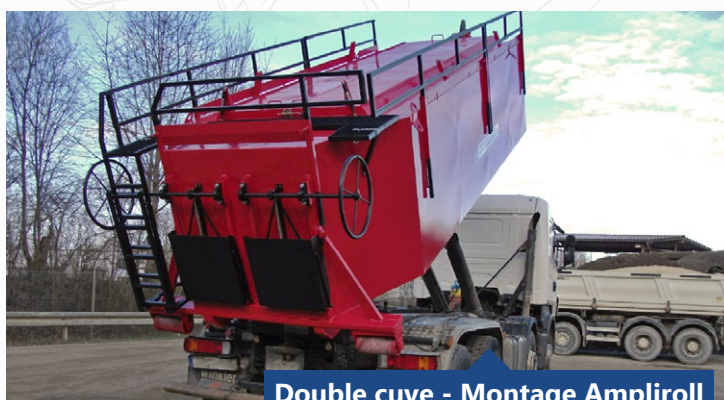
Double cuve - Montage Ampliroll

Retrouvez toutes les photos et applications de cet équipement sur notre site internet www.rdsfrance.com