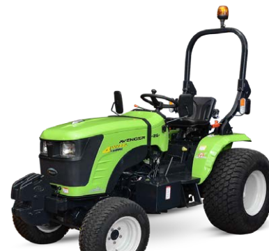
Preet 26 cv Pneus gazon

Le tracteur Preet 26 cv est disponible en pneus gazon pour s'adapter à vos conditions de terrain.