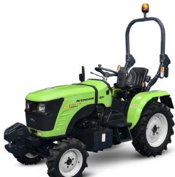
Preet 20 cv Pneus agraires

Avec ses dimensions compactes et sa grande maniabilité, le micro tracteur Preet 20 cv vous permettra d'atteindre les zones les plus difficiles d'accès.