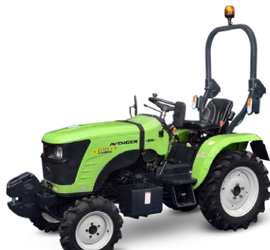
Preet 26 cv Pneus agraires ou indus.

Avec 26 cv sous le capôt et une conduite toute en souplesse sur n'importe quel terrain, ce micro-tracteur est une valeur sûre à un prix abordable.