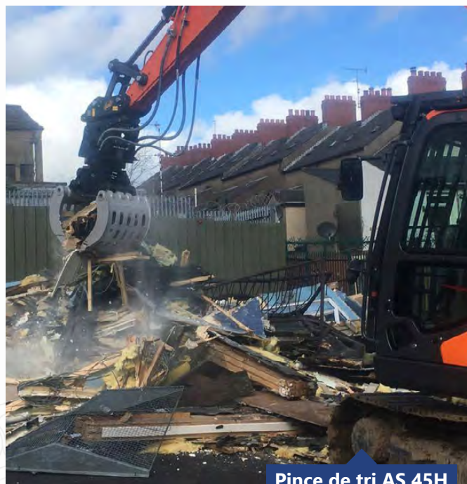
Pince de tri AS 45H