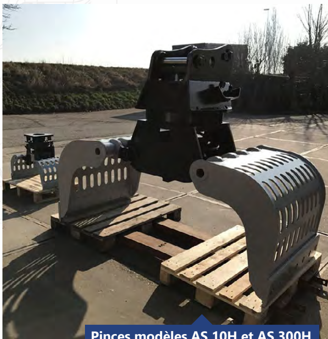
Pinces modèles AS 10H et AS 300H

Dimensions et informations techniques données à titre indicatif. Le constructeur se réserve le droit de les modifier sans préavis. Photos non contractuelles. Crédits photos : RDS France - AJCE - Septembre 2023